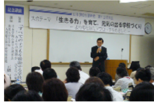
理事長による記念講演の様子

年1回の大会への参加が可能です。最先端の現場での研究を学ぶことができます。大会での「学生交流コーナー（仮）」でのポスター発表が可能です。現場の小・中・高・大学教員の皆様や、行政職、スクールカウンセラー等の皆様から研究への助言がもらえます。大会時に行われる懇親会に参加が可能です。会食をしながら親睦を深めることができます。