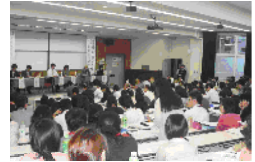
パネルディスカッションの様子